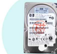
日本方式物理破壊