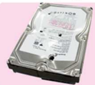
アメリカ方式物理破壊