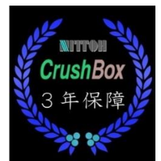
Crush Box DB-35 III